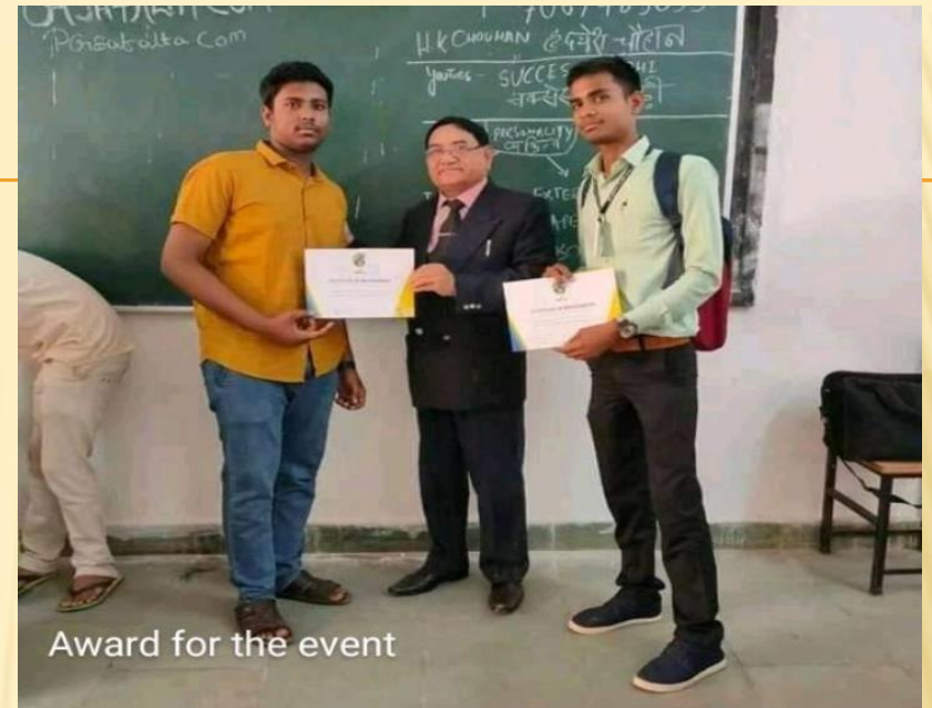
Award for the event